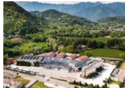
Centro raccolta uve, vinificazione, spumantizzazione e imbottigliamento a Pieve di Soligo