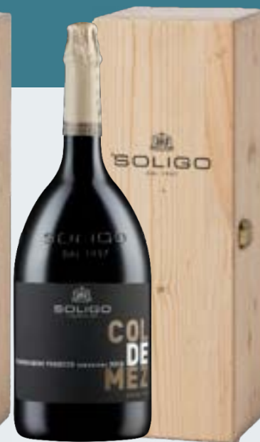
Jéroboam COL DE MEZ Extra Dry 3L Cod. SBCQ5 Only with wooden box