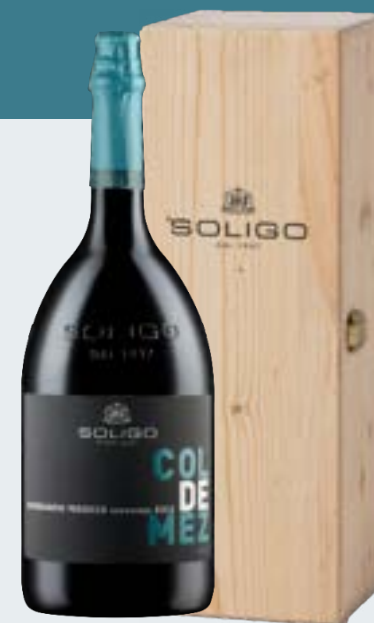
Jéroboam COL DE MEZ Brut 3L Cod. SECQ5 Only with wooden box