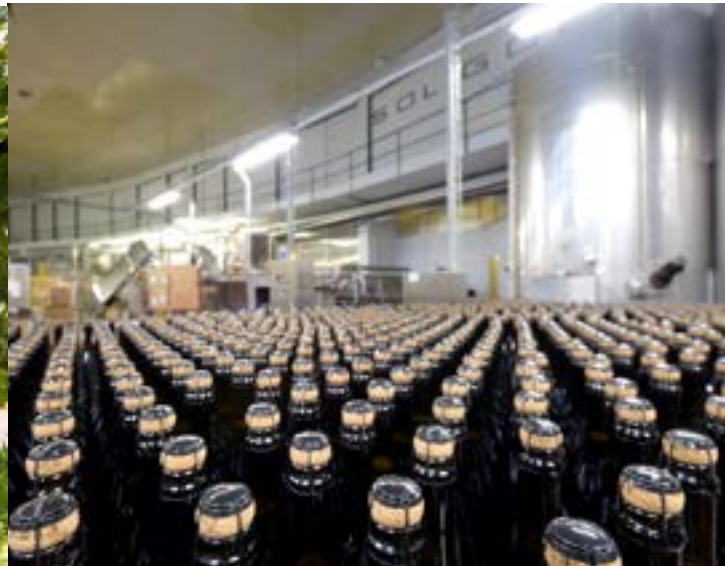
Unsere Abfülllinie in Pieve di Soligo.