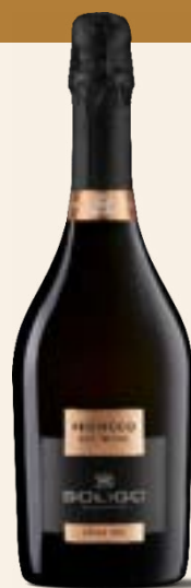
PROSECCO DOC TREVISO Extra Dry

Einen PROSECCO DOC mit einem reduzierten Alkoholgehalt von 9%, der dem Schaumwein eine ausgeprägte Trinkbarkeit verleiht, während die Aromen der Glera-Traube erhalten bleiben; sein Restzuckergehalt unterstreicht seine Typizität und bewahrt seine Frische.