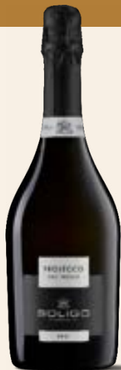
PROSECCO DOC TREVISO Brut

Die Auswahl der Trauben macht diesen Millesimato unglaublich elegant und repräsentativ für jeden Jahrgang in unserer Region. Am Gaumen ist er voll und angenehm würzig, mit einem langen und angenehmen Abgang.