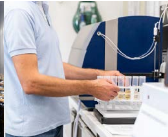
Unser önologisches Labor in Pieve di Soligo.