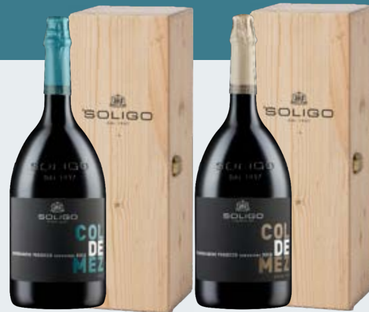
Jéroboam COL DE MEZ Brut 3L Cod. SECQ5 Only with wooden box