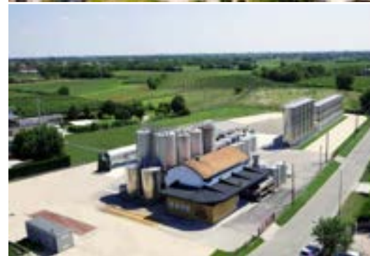
Standorte Sammelstelle und Vinifikationsanlage in Arcade (TV).