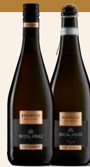
PROSECCO DOC TREVISO STELVIN-LIGÀ Perlwein

Ein Wein mit unverwechselbarem Charakter. Die Frische und Eleganz des Glera wird durch 10 % Pinot Noir ergänzt, der die aromatische Komponente bereichert und dem Wein eine leuchtend zartrosa Farbe verleiht.