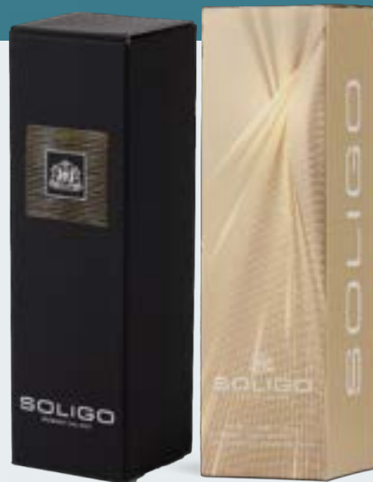
MAGNUM GIFT BOX Black carton Cod. ASTUCCIOIR Gold carton Cod. ASTUOROIM