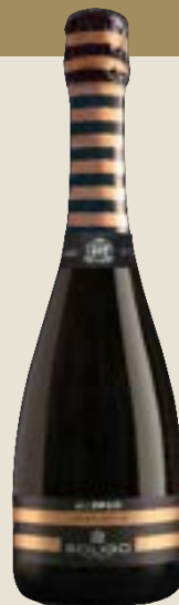
ALLUNGO Millesimato Spumante Extra Dry

Ein Wein von großer Trinkfreudigkeit, der dank seiner geschmacklichen Frische ein hervorragender Begleiter in Momenten fröhlicher Geselligkeit ist: Aromen von weißfleischigen Früchten werden von einem mineralischen Abgang begleitet.