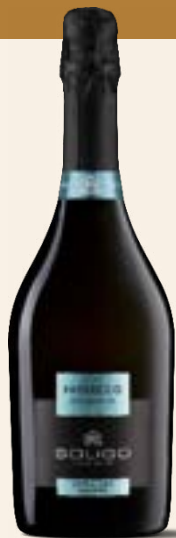
PROSECCO DOC TREVISO Millesimato Extra Dry

Leidenschaft und Tradition sind der Schlüssel zu diesen Weinen, die sich durch ihre Frische und ihre zarten Aromen auszeichnen. Eine Linie aus ausgewählten Trauben aus der Provinz Treviso, dem Herzen des Prosecco DOC.