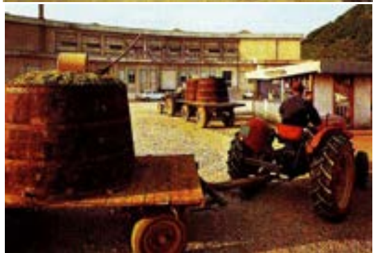
Standorte Die Anlieferung der Trauben erfolgte in den 70er Jahren. Sammelstelle, Vinifikations-, Schaum- und Abfüllanlage in Pieve di Soligo.