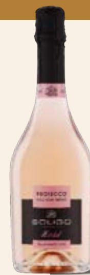
PROSECCO DOC TREVISO Millesimato Rosé Brut

Schaumwein aus unseren Weinbergen in der Provinz Treviso, hergestellt nach der Charmat-Methode. Dieser frische, weiche und ausgewogene Extra Dry hat die Gaumen der internationalen Jury überzeugt und wurde mit zahlreichen Preisen ausgezeichnet. Die Persistenz wird von der Würze des Abgangs bestimmt.