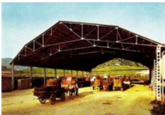
Standorte Die Anlieferung der Trauben erfolgte in den 70er Jahren. Sammelstelle, Vinifikations-, Schaum- und Abfüllanlage in Pieve di Soligo

die stolz auf ihre Wurzeln und auf die Zukunft ausgerichtet ist. Heute bewirtschaften unsere 600 Mitglieder 1.000 Hektar Weinberge , davon etwa 85 % mit der Rebsorte Glera (Prosecco). Der Rest ist mit Pinot Grigio, Chardonnay, Sauvignon Blanc, Merlot, Pinot Noir, Cabernet Franc und Sauvignon bepflanzt. Im Jahr 2019 kamen auf ausgewählten Weinbergen die widerstandsfähigen Rebsorten Johanniter und Souvignier Gris hinzu, die unsere zunehmende Ausrichtung auf nachhaltigen Weinbau widerspiegeln.