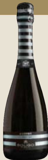
ALLUNGO Millesimato Spumante Brut

Zusammensetzung verschiedener Rebsorten, die der Perlage Leben einhauchen und in der Lage sind, durch ihre Vielseitigkeit zu überzeugen und jeden Moment des Tages zu begleiten.