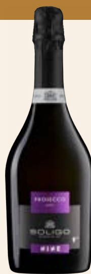
PROSECCO DOC NINE Dry

Prosecco d'une grande élégance aux parfums de fruits frais, de biscuit et de fleurs qui vont de l'acacia au lys et au muguet. La bouche est délicate, harmonieuse et agréablement persistante.