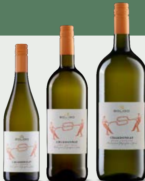
CHARDONNAY Marca Trevigiana IGT

L'environnement pédoclimatique permet au Pinot gris de développer pleinement toutes ses composantes typiques, telles que l'acidité et le bouquet aromatique ample et fruité. Ce vin à la robe jaune paille lumineuse est délicat et frais en bouche, avec un bon équilibre.