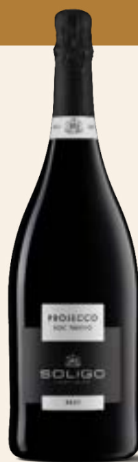
PROSECCO DOC TREVISO Brut

0,200 L 0,375 L Magnum Cod. SPEX0 Cod. SPEX375 1,5 L Cod. SPME3