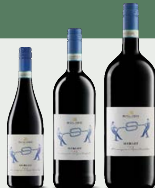
MERLOT DOC delle Venezie

Ce cépage international trouve dans la zone du Quartier del Piave un climat optimal pour exprimer pleinement son style. Ce vin offre de délicats parfums fruités de pêche, d'ananas et d'agrumes, suivis de notes florales et minérales.