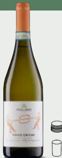
PINOT GRIGIO DOC delle Venezie

Un Conegliano Valdobbiadene d'une rare authenticité. Ses notes fruitées s'accompagnent des notes de fleurs typiques du raisin Glera qui provient d'un seul vignoble de la zone DOCG Conegliano Valdobbiadene.