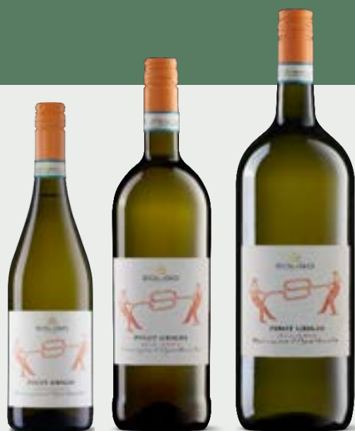
PINOT GRIGIO DOC delle Venezie

0,75L Cod. TVPG1 1L Cod. TVPG2 1,5L Cod. TVPG3