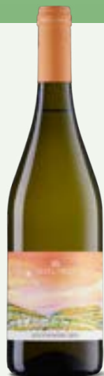
SOUVIGNIER GRIS Veneto IGT

Cod. TSOG1 Variété Souvignier Gris Alcool 12% vol.