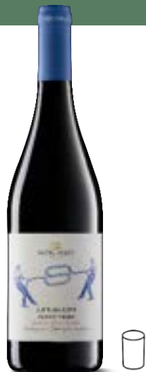
'LEVIGATO' PINOT NERO Marca Trevigiana IGT

Née de la volonté de préserver un lien fort avec le passé, cette ligne destinée aux amateurs de vins tranquilles est produite pour valoriser la spécificité de chaque cépage et du terroir où il puise ses caractéristiques.