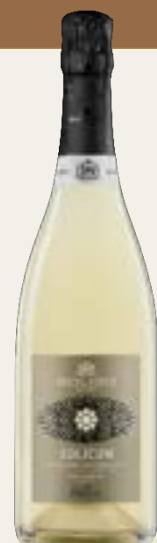
VELAR - SOUS VOILE Brut Nature

Cod. SPCA1 Variété Glera Alcool 11,5% vol. Sucre 1 g/l