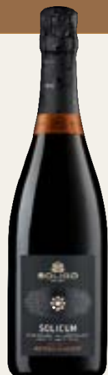
METODO CLASSICO Millésimé Brut

Cod. SPDM1 Variété Glera Alcool 11% vol. Sucre 25 g/l