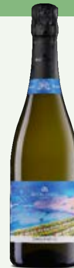
JOHANNITER Spumante Brut

Les grappes sont vendangées au début du mois de septembre puis, au bout de cinq jours de macération, 30 % des grappes poursuivent leur maturation en barriques pendant six mois. Le Souvignier gris, à la robe jaune doré, offre des parfums d'épices douces de vanille, de clou de girofle et de réglisse, qui s'accompagnent de souvenirs agrumés de cédrat et de citron. Un vin à la bouche séduisante et enveloppante avec une finale épicée.