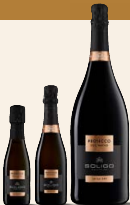
PROSECCO DOC TREVISO Extra Dry

0,200 L 0,375 L Magnum Cod. SPEX0 Cod. SPEX375 1,5 L Cod. SPME3