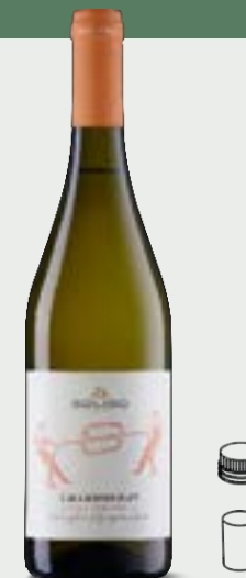
CHARDONNAY Marca Trevigiana IGT

Ce célèbre cépage international semi-aromatique, élevé en cuves d'acier pour exalter sa spécificité, se distingue par son élégante intensité olfactive et par sa fraîcheur gustative. Le bouquet est ample, reconnaissable et franc, avec des arômes agrumés de cédrat et de pamplemousse, suivis de notes de pêche blanche, de thym, de sauge et de feuille de tomate.