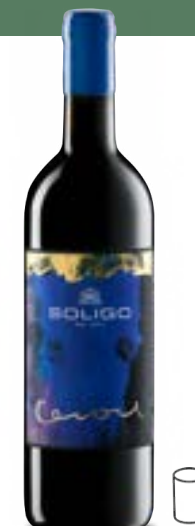
'CESARE' Colli Trevigiani IGT

Le raisin est vendangé à pleine maturité afin qu'il puisse développer pleinement la composante phénolique. Dans la cave, la fermentation pelliculaire dans des vinificateurs en acier dure pendant quinze jours. C'est alors que débute une période de maturation d'au moins six mois dans des cuves en acier. Une partie est conservée dans un grand fût pendant 5 mois.