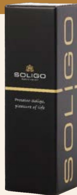
ENVASES PARA MAGNUM