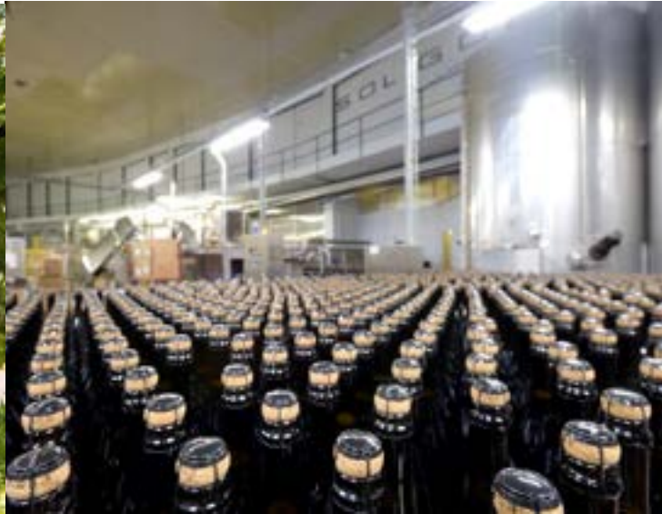
Nuestra línea de embotellado en Pieve di Soligo.