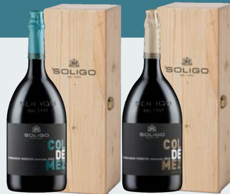
Jéroboam COL DE MEZ Brut