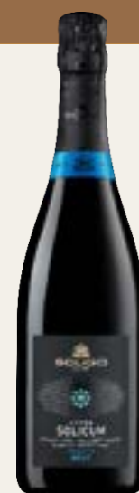
CUVÉE Brut Millesimato

Cód. SPLI1 Variedad Glera Alcohol 11,5% vol. Azúcares 0 g/l