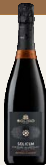
MÉTODO CLÁSICO Millesimato Brut

Cód. SPDM1 Variedad Glera Alcohol 11% vol. Azúcares 25 g/l