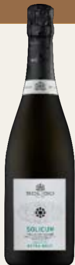
RIVE DI SOLIGO Extra Brut Millesimato

Cód. SPBZ1 Variedad Glera Alcohol 11,5% vol. Azúcares 2 g/l