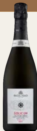
RIVE DI SOLIGO Millesimato Dry

Cód. SPRB1 Variedad Glera Alcohol 11% vol. Azúcares 3 g/l