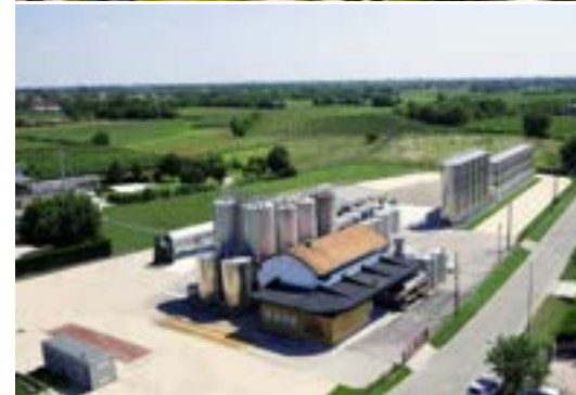
Centro de recogida de uvas y vinificación en Arcade (TV)